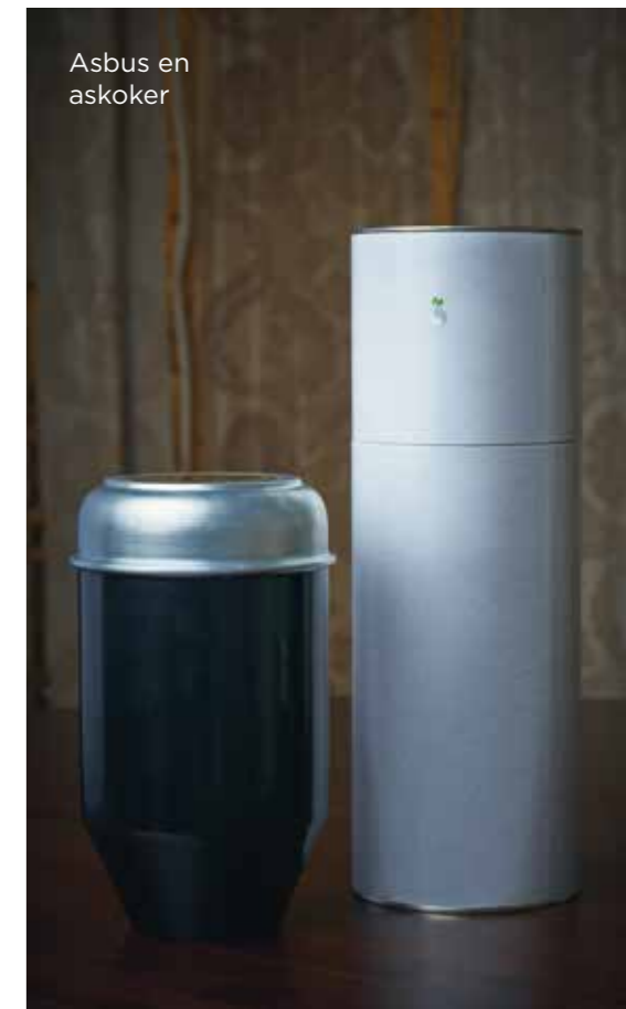
Asbus en askoker