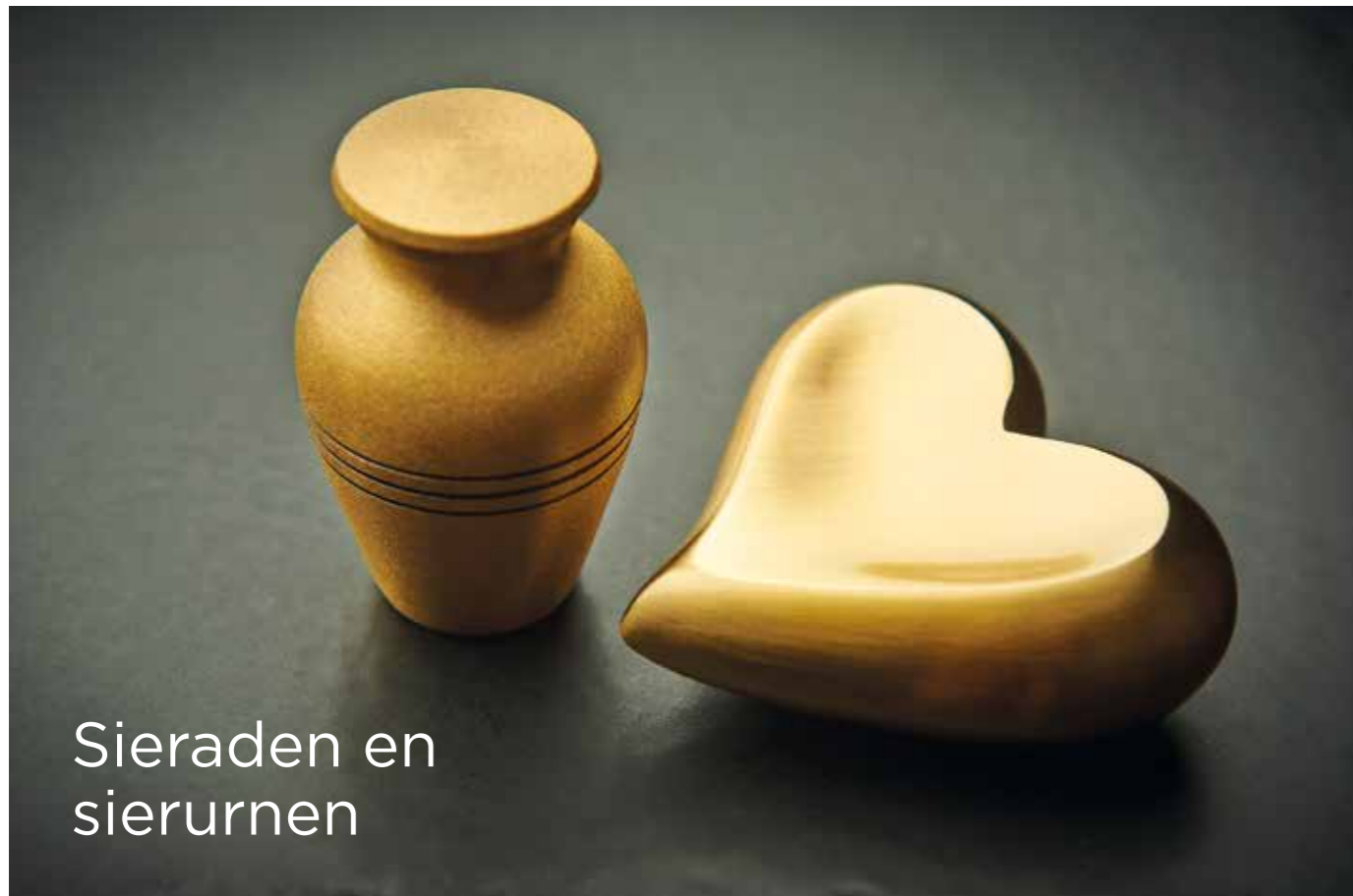
Sieraden en sierurnen

Een mogelijkheid is om wat as te laten verwerken in een sieraad. Zo is er sprake van een persoonlijke en zeer tastbare herinnering aan de overledene, u draagt het sieraad altijd dicht bij u. De Boskamp beschikt over een unieke en speciaal voor het crematorium ontworpen collectie sieraden. Ook kunt u ervoor kiezen de as zelf te bewaren, in een sierurn die u thuis een mooie plaats kunt geven. In onze toonzaal krijgt u een goed beeld van de vele mogelijkheden. Onze medewerkers geven u graag meer informatie.