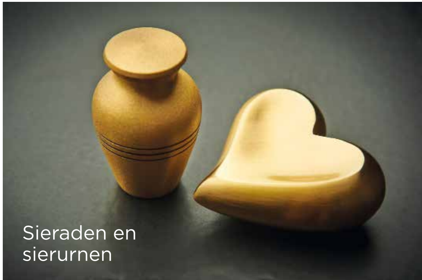
Sieraden en sierurnen

Een mogelijkheid is om wat as te laten verwerken in een sieraad. Zo is er sprake van een persoonlijke en zeer tastbare herinnering aan de overledene, u draagt het sieraad altijd dicht bij u. De Boskamp beschikt over een unieke en speciaal voor het crematorium ontworpen collectie sieraden. Ook kunt u ervoor kiezen de as zelf te bewaren, in een sierurn die u thuis een mooie plaats kunt geven. In onze toonzaal krijgt u een goed beeld van de vele mogelijkheden. Onze medewerkers geven u graag meer informatie.